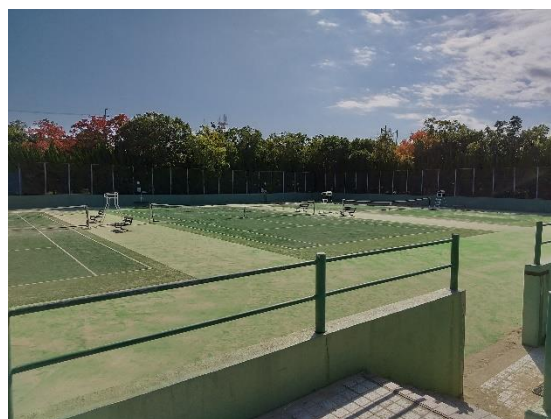
【写真④】テニスコート