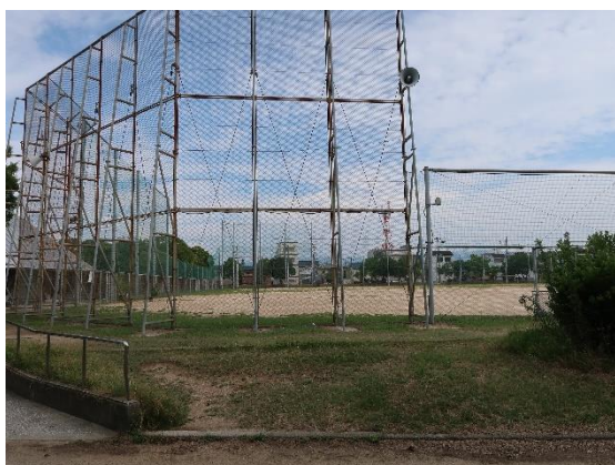
【写真③】多目的グラウンド