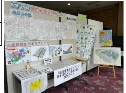
山直市民センターでの展示

基本計画では、地域の皆様の声をもとにした基本コンセプトを作成し、その実現のために市の計画と関連づけた基本構想等が盛り込まれています。