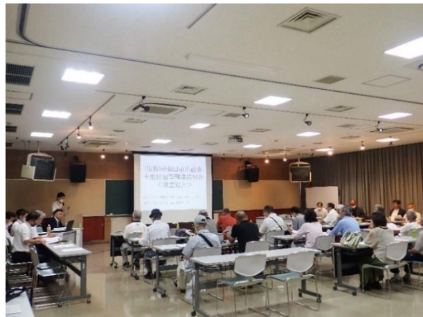
↑ ↓ 総会の様子