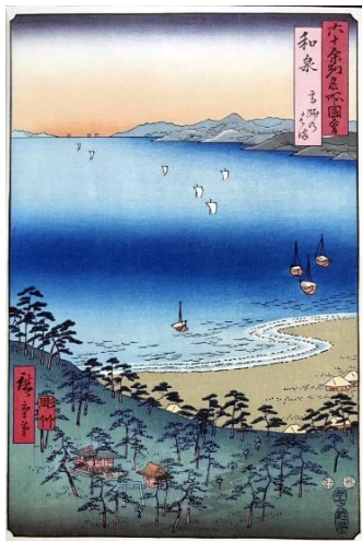
歌川広重 六十余州名所図会 「和泉國高師ノ濱」

「牛滝山&堺・住吉編」に続く、「描かれた泉州」の第2回展示です。江戸から昭和にかけて描かれた泉州地域の風景をご覧ください。