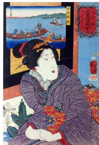
一勇斎國芳 山海愛度図会 「あとが聞たい(泉州飯蛸)」