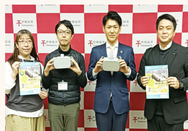
市長もVR体験をしました

な支援や交流の機会が減少していき、孤立感を感じることもあるかもしれません。多感な時期の高校生に「職業体験」や「社会交流」の機会を作ること、将来の選択肢を広げ、自尊心を育み、希望を持って社会で生きていく支援をしたいと思っています。