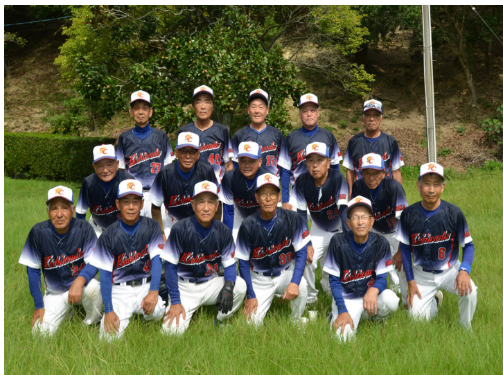
岸和田クラブハイシニア

岸和田クラブは、2001年にシニア（59歳以上）、2006年にはハイシニア（68歳以上）を設立しました。これまでに、大阪府代表としてシニアは8回、ハイシニアは12回、地区予選大会を突破し全国大会に出場しています。