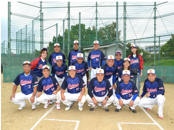
岸和田クラブシニア