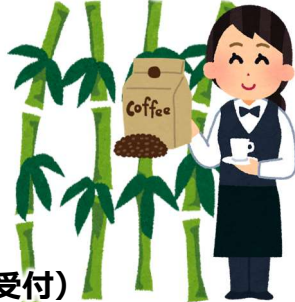
竹炭コーヒー販売