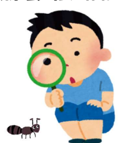
自然観察会 (要当日受付)