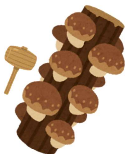
しいたけ菌打ち (要当日受付)