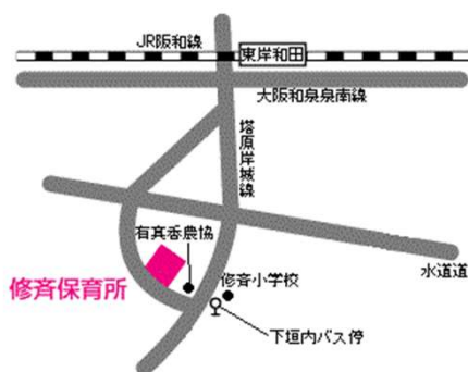
修斉保育所アクセスマップ