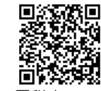
国税庁LINE公式アカウント

※LINEで国税庁を「友だち登録」したあと、メニュー画面（確定申告書の作成）から自宅でe-Tax送信ができます。