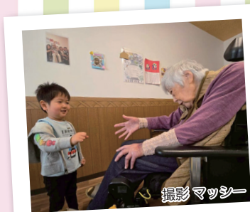
102歳のひいひい おばあちゃんと4歳の やしゃごのじゃんけんぽん

今号の特集は「手話」。中学生の頃にドラマ「オレンジデイズ」を見て、手話への関心とキラキラした大学生活に憧れを抱いていたことを思い出しました。作中、ドライブをしながら、当時の流行曲を手話を交えて歌うシーンが今でも印象に残っています。 今まで、手話を学ぶ一歩が踏み出せずにいましたが、今号から掲載を始める「手話しよう」で、まずは単語から覚えたいと思います。（Y）