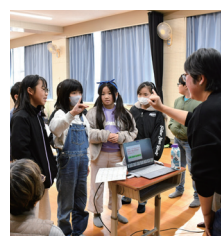
休憩時間に手話で質