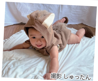
馬になってみたよ～！ 2026年も 元気いっぱい遊ぶぞ♪