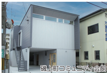
磯上町コミュニティ会館

(一財)自治総合センターでは、宝くじの受託事業収入を財源とする社会貢献広報事業のひとつとして、コミュニティ助成事業を実施しています。本市では、地区市民協議会、町会などがこの助成を受け、活動に役立てています。令和7年度は、磯上町が助成金を活用し、コミュニティ活動を推進するための拠点としてコミュニティ会館を新築しました。