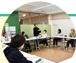
手話サークル活動の様子

手話サークルで学習を続け、指導している体操教室でいつか「手話の体操教室」ができたと思っています。