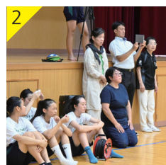
手話ダンスをチェック