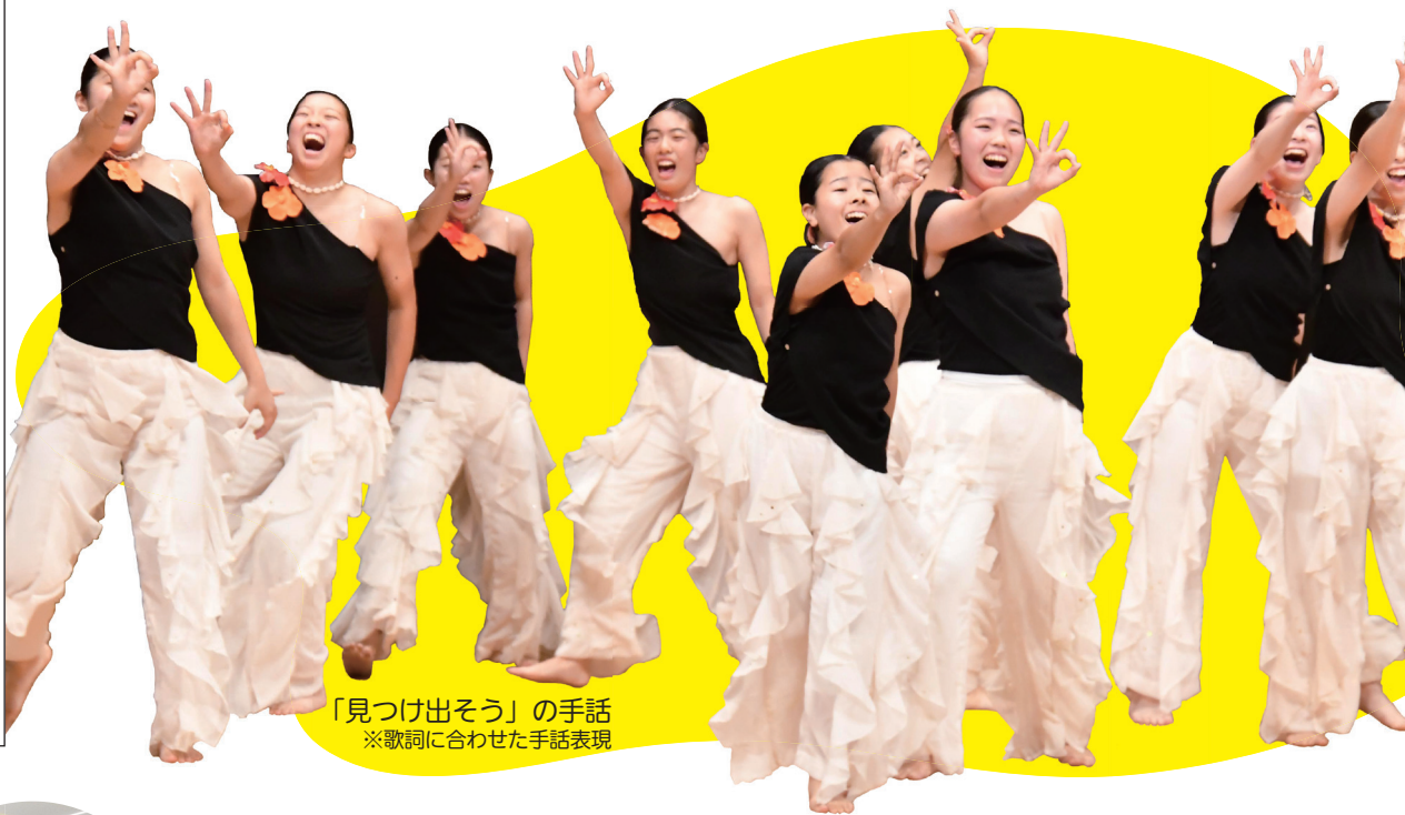
「見つけ出そう」の手話 ※歌詞に合わせた手話表現