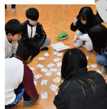
指文字カードでゲーム