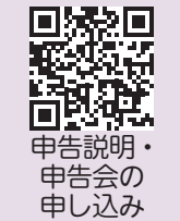
申告説明・申告会の申し込み

また、電子申告の周知のため、表のとおり「市・府民税電子申告説明・申告会」を開催します。職員による申告サポートも行いますので、参加を希望する人は、QRコードまたは電話でお申し込みください。