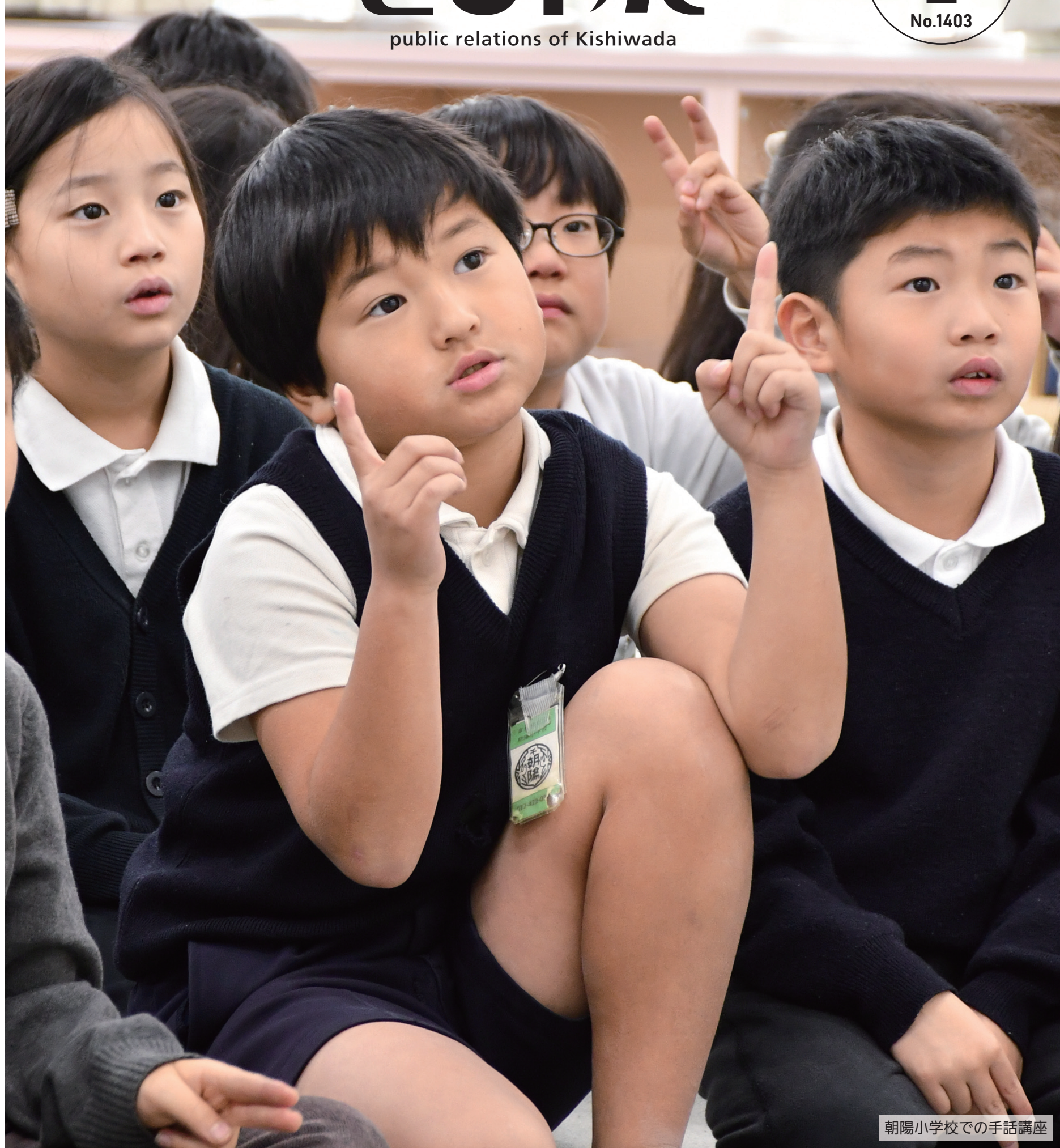
朝陽小学校での手話講座