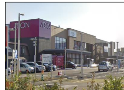
イオンスタイル東岸和田店