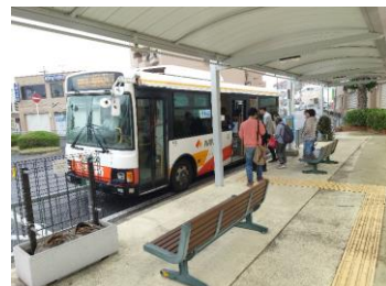
無料デー実施日の下松駅前