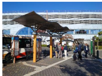
無料デー実施日の岸和田駅前