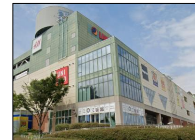
岸和田カンカンベイサイドモール