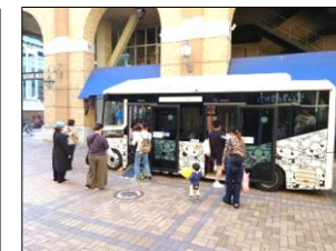
イベント開催に併せた車両の展示・車内見学