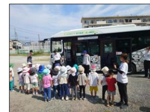
乗り方教室の開催・園児絵画展示（春木保育所）