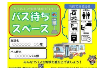
バス待ちスペースステッカーイメージ