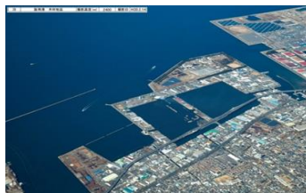
【木材コンビナート貯木場】