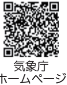
気象庁ホームページ