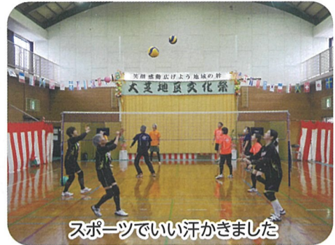
スポーツでいい汗かきました