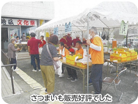
ざつまいも販売好評でした