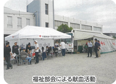
福祉部会による献血活動