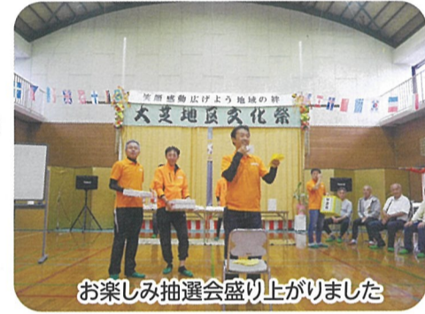
お楽しみ抽選会盛り上がりました