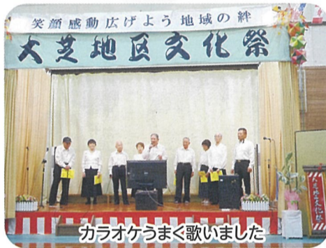
カラオケうまく歌いました