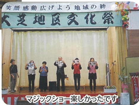
マジックショー楽しかったです