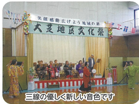
三線の優しく新しい音色です