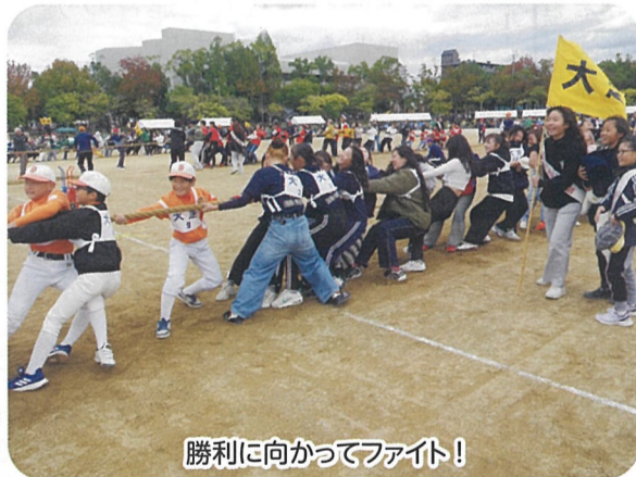
勝利に向かってファイト!