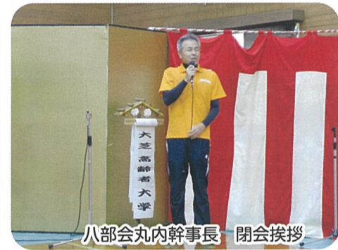
八部会丸内幹事長 閉会挨拶