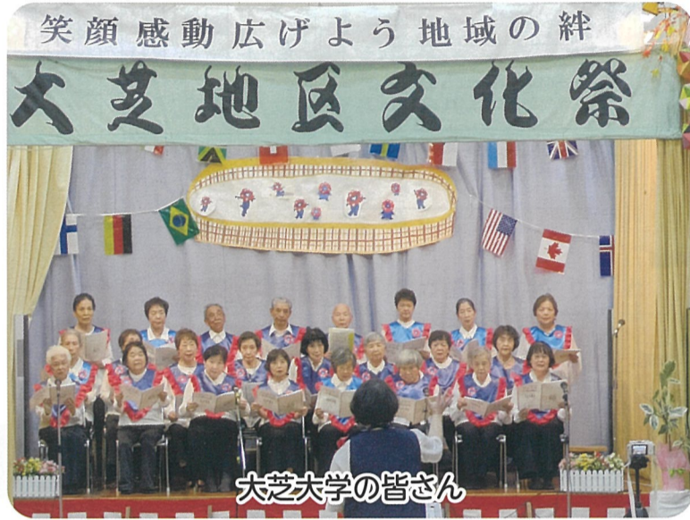
大芝大学の皆さん