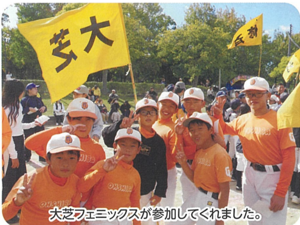
大芝フェミックスが参加してくれました。