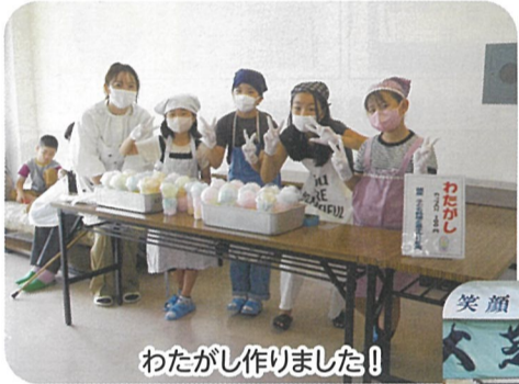
わたがし作りました!