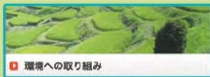
環境への取り組み