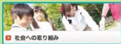
社会への取り組み