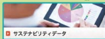
サステナビリティデータ