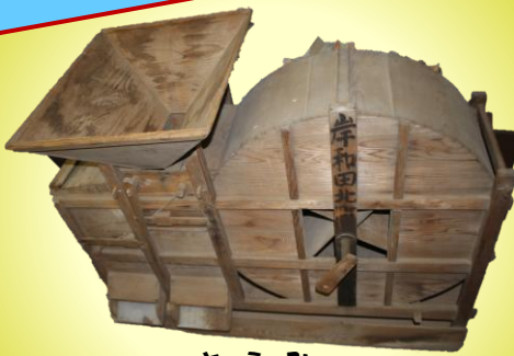
とうみ 唐箕 本市所蔵