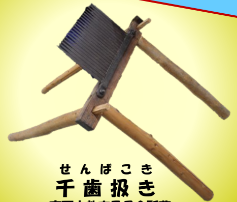
せんぼこき 千齒扱き 高石市教育委員会所蔵