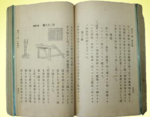
のうぎょうきょうかしよ 農業教科書 本市所蔵