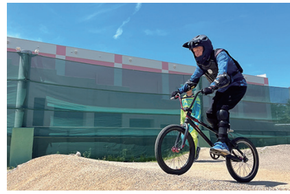
WMG2027に向け、BMXレーシング体験も実施(本紙11面参照)