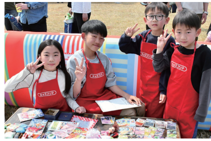
子どもだけのフリーマーケット「岸和田けいりん de キッズフェスタ」