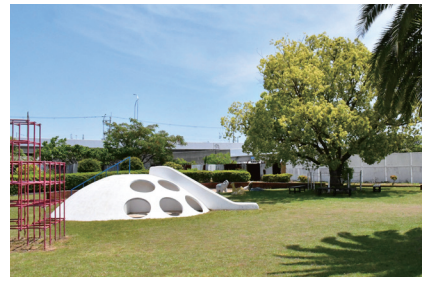
遊具もある児童公園