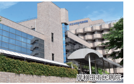
岸和田市市民病院