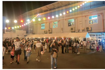
毎夏、多くの人で賑わう「夕涼み会」

競輪を知らない人でも訪れやすい、地域に開かれた場所として、競輪場は新たな魅力を広げています。