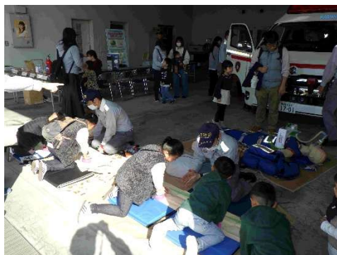
消防フェア（救命講習）