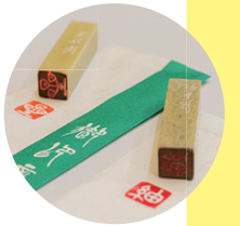
石のはんこづくり