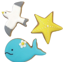
アイシングクッキー