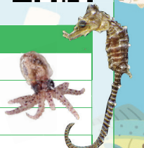
チリメンモンスター