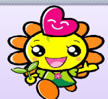
アカルイーネちゃん