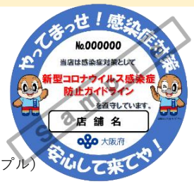
感染防止宣言ステッカー（サンプル）