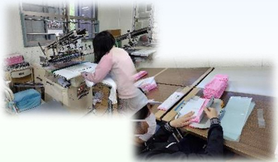
(タオルへの印刷から、梱包まで)

名入りタオルのプリントから包装までワンストップで受託できる点が強みで、繁忙期の年賀タオルだけでなく、通年需要のあるホテル・民宿向けの販売を強化し、工賃向上や一般就労者の輩出につなげています。