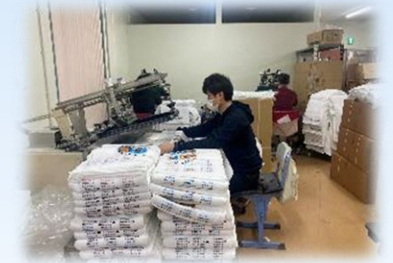
(タオルへの印刷作業の様子)

タオル事業部が白タオルを仕入れ、外部と同単価で作業所にプリント・梱包をしてもらい、タオルを販売します。立ち上げ当初は、仕入れ代などの経費が高み、苦戦しました。そこで、福祉事業所ならではの小ロット対応などを売りに、関西一円の旅館・ホテル・温泉などに営業努力を続けた結果、軌道に乗り、現在、タオル販売事業は、約150社と取引し、工賃向上に繋がりました。