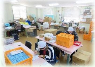
(重度障がいをお持ちの方々の作業の様子)

現在、B型事業所の重度障がいの利用者は10名で、タオル個包装の作業に取り組んでいます。